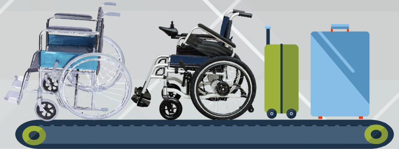
รถวีลแชร์แบบเข็นและแบบใช้พลังงานแบบตยที่ไม่ใช้ลิเธียมไอออนต้องโหลดใต้ท้องเครื่องบิน (Check-in Baggage)

ส่วนรถวีลแชร์แบบเข็นด้วยตนเองและแบบใช้พลังงานแบบตยที่ไม่ใช้ลิเธียมไอออน ต้องโหลดใต้ท้องเครื่องบิน (Check-in Baggage) โดยผู้โดยสารสามารถส่งรถวีลแชร์ได้ที่เคาน์เตอร์เช็คอินของสายการบินที่เดินทางหรือสามารถใช้รถวีลแชร์ของตนเองได้จนถึงประตูขึ้นเครื่องบิน (Gate) และส่งมอบให้พนักงานของสายการบินนำไปโหลดใต้ท้องเครื่องบินต่อไป (ทั้งนี้ขึ้นอยู่กับนโยบายของแต่ละสายการบิน)