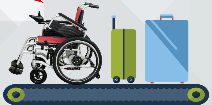
รถวีลแชร์ที่ใช้แบตเตอรี่ลิเธียมไอออนต้องถอดแบตเตอรี่ออกก่อนโหลดใต้ท้องเครื่องบิน (Check-in Baggage)