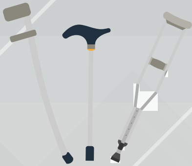
นำติดตัวขึ้นเครื่องบินได้เลย (Carry-on Baggage)

ผู้โดยสารสามารถนำอุปกรณ์ช่วยเคลื่อนไหวที่ไม่มีแบตเตอรี่ขึ้นเครื่องบินได้เลย (Carry-on Baggage) เช่น ไม้เท้าหรือโครงเหล็กช่วยเดิน